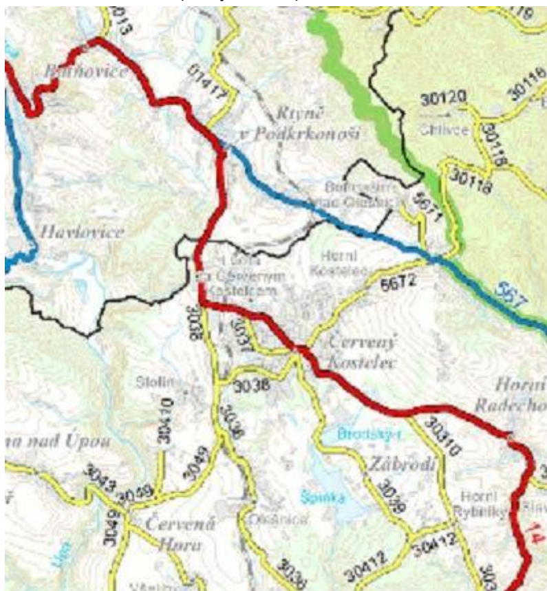
Obrázek 1 Silniční síť

Dopravní infrastruktura v návrhu Návrh ÚP Červený Kostelec je navržena invariantně. V rámci návrhu územního plánu jsou navrženy následující stavby dopravní infrastruktury: