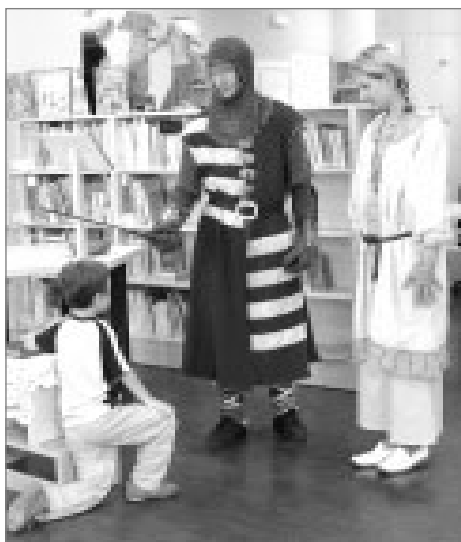
Jako první byli pasováni prvňáčci ze ZŠ Komenského.