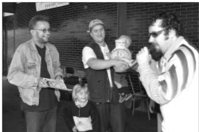
Vyhlášení vítěze akce „Pochod 10 hospod Náchodskem“