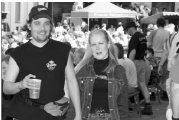
Návštěvníci na akci Den s Primátorem

Náchodský pivovar získal v červnu dvě nová ocenění. Obě obdržel na 9. ročníku degustační soutěže „Pivo České republiky 2005“, kterou pořádalo Výstaviště České Budějovice, a. s., v rámci Slavností piva ve svém areálu ve dnech 10.-11. 6. 2005. Do soutěže bylo v devíti kategoriích přihlášeno celkem 179 vzorků piva od 41 pivovarů (z toho dva slovenské) a Primátor získal 2. místo s pivem Diamant v kategorii piv se sníženým obsahem cukru a 3. místo v kategorii piv nealkoholických. Vlastní soutěžní degustace, které prováděli anonymně sládkci a další kvalifikovaní odborníci z pivovarů celé České republiky, jsou počtem přihlášených druhů piv nejvýznamnější akcí svého druhu v republice.