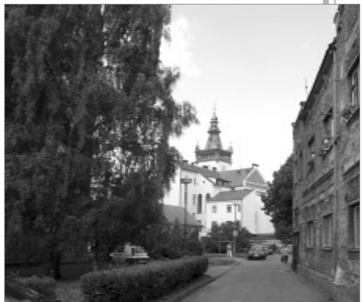
Pohled stejným směrem dnes