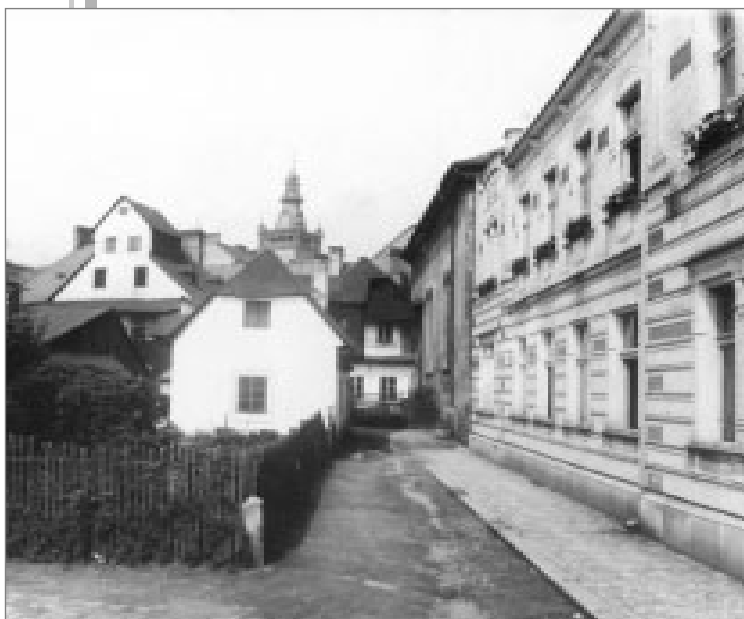
Židovská ulice z Parkánů v roce 1930